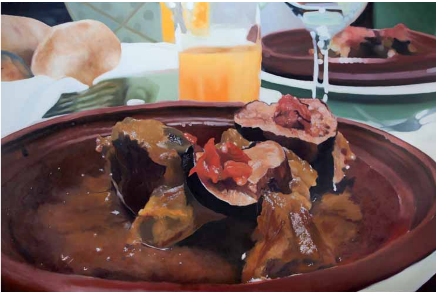
«Tajine aux aubergines et à la tomate», 100 x 150 cm, toile qui sera mis en vente chez Mazad&Art le 21 Juin à Casablanca.